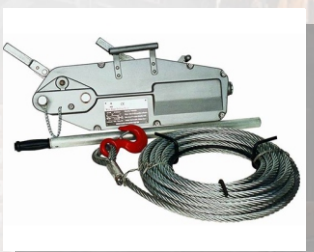
Монтажно-тяговое устройство MTM-0,8

Грузоподъемность, т: 0,8 Длина каната, м: 20