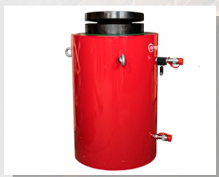
Домкрат грузовой с гидравлическим возвратом ДГ200Г400