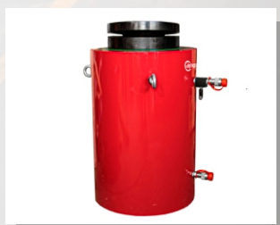
Домкрат грузовой с гидравлическим возвратом ДГ10Г300

Усилие, тс: 10 Ход штока, мм: 300 Габариты, DxH, мм: 70x430