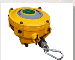
Пружинный балансир HW-90

Длина троса, м: 1,5 Уравновешиваемая нагрузка, кг: 80-90 Масса, кг: 13