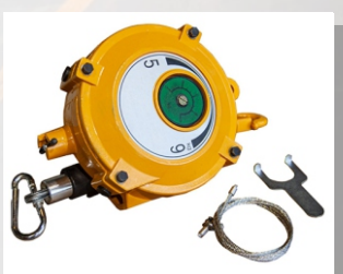
Пружинный балансир HW-140

Длина троса, м: 1,5 Уравновешиваемая нагрузка, кг: 120-140 Масса, кг: 17,6