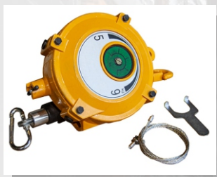
Пружинный балансир HW-40

Длина троса, м: 1,5 Уравновешиваемая нагрузка, кг: 30-40 Масса, кг: 10