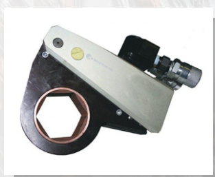
Гайковерт кассетный 500 кгм ГКГ500

Крутящий момент, кгм: 500 Размеры гаек под ключ, мм: 21-80 Рабочее давление, (МПа): 70