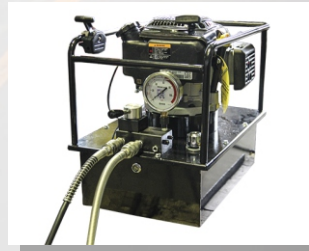
Станция насосная с бензоприводом, двухступенчатая НБР2/70-6/0,9И15-2

Подача 1/2 ступенях, л/мин: 6/0,9 Объем бака, л: 15 Давление 1/2 ступенях, МПа: 2/70