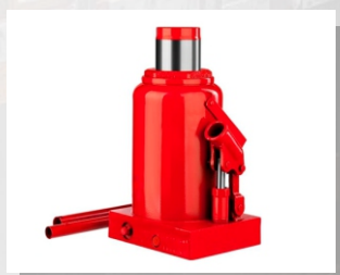
Домкрат автономный ДГ-25