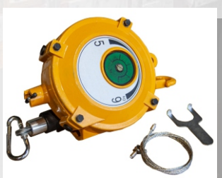
Пружинный балансир BT275-1,5

Длина троса, м: 1,5 Уравновешиваемая нагрузка, кг: 250-275 Масса, кг: 52