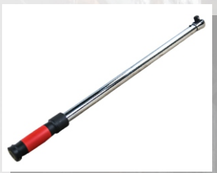
Ключ динамометрический T-10HD

Выходной квадрат, дюйм: 3/4 Крутящий момент, Нм: 200-1000