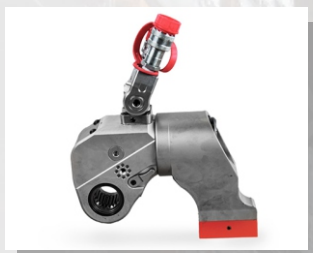
Гайковерт гидравлические со сменной головкой TEV-45S

Крутящий момент, Нм: 451-4512 Размеры головок под ключ, мм: 22-48 Выходной квадрат, дюйм: 1"