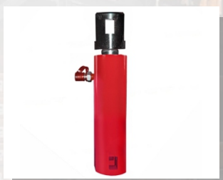
Домкрат тянущий с пружинным возвратом ДО50П150-PRO

Усилие, тс: 50 Ход штока, мм: 150 Габариты, DxL: 168x800