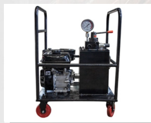
Станция насосная с бензоприводом НБР-2,0И20-1

Подача, л/мин: 2 Объем бака, л: 20 Габариты, мм, ШхДхВ: 560x345x665