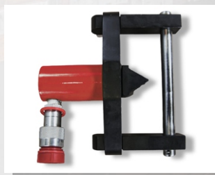
Разгонщик фланцевых соединений гидравлический, исполнение «хомут», РФ1066

Усилие, тс: 10 Ход штока, мм: 54 Диаметр условный, Ду (DN), мм: 76-1066