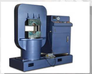
Пресс для опрессовки стальных канатных стропов с комплектами матриц от 6 до 45 мм в количестве 23 шт. ADV-800K

Макс. усилие, кН (тс): 8000 (800) Диапазон типоразмеров опрессовываемых AL втулок, в 1 / 2 стадии: от 6 до 40/52 Макс. рабочее давление, МПа: 56