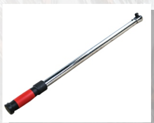
Ключ динамометрический T-08HD

Выходной квадрат, дюйм: 3/4 Крутящий момент, Нм: 150-800