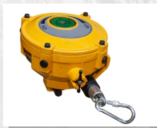
Пружинный балансир HW-22

Длина троса, м: 1,5 Уравновешиваемая нагрузка, кг: 15-22 Масса, кг: 17,6